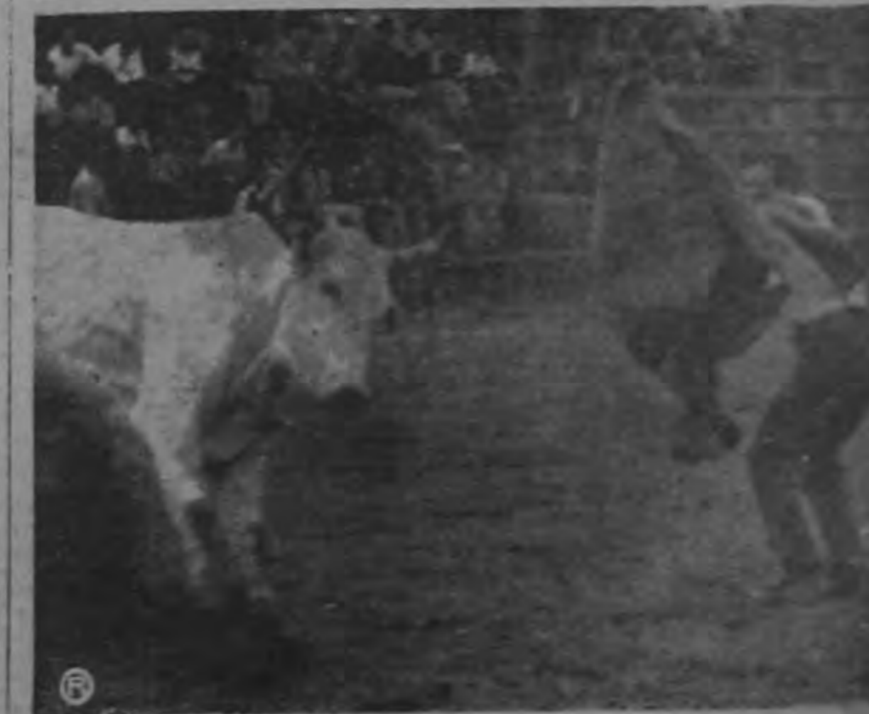
¿Qué suerte? El toro arremete furiosamente contra uno de los toreros, logrando únicamente después lanzar por los aires la chaqueta con que intentó sacarle una suerte. Este fué uno de los brutos que se torcieron el 24 de diciembre en Plaza González Víquez.

La Escuela de Temporada ofrece diversos cursos de capacitación técnica y de ampliación cultural sobre todos los cuales hemos informado en diversas ocasiones. Para obtener informaciones correspondientes o matricularse en cualquier asignatura los interesados deben dirigirse al Departamento de Registro, situado al costado sur del edificio central de la Universidad B. González Lahmann,