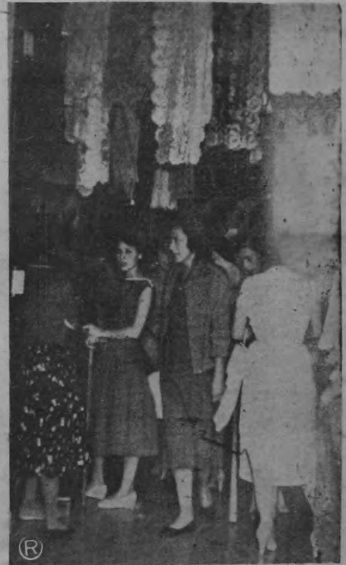
ASI ESTABAN MUCHAS TIENDAS AYER: — La grava de Solano demuestra contundentemente que aún ayer en horas de la tarde, el comercio capitalino continuaba vendiendo meraderías a granel. Esta tienda se ve abarrotada de clientes, deseosos de comprar sus estrenos para los días de fiestas de fin de año.

ventas, este año alcanzaron niveles nunca antes logrados, lo que viene a resultar un tapa boca para los que han estado haciendo de aves agoreras manifestando que la situación económica porque atraviesa el país es grave. El dinero este año fluyó con más facilidad por todo Costa Rica, lo que es sintoma de magnífica situación económica que se refleja, sin lugar a dudas, en la capacidad adquisitiva del pueblo que ha podido, con sus salarios, aguinaldos y economías, cumplir todos los compromisos navideños y de fin de año que fueron colmados hasta la saciedad.