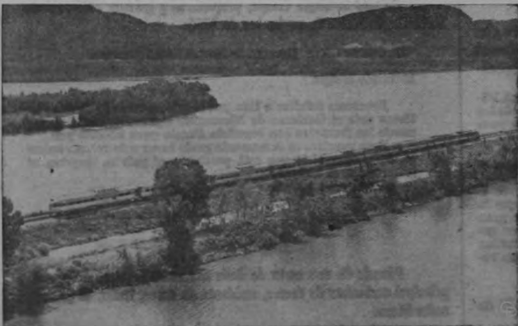
El tren más rápido de los Estados Unidos el Twin Zephyr de Burlington, pasa como un relámpago a lo largo del banco del Mississippi. Promedio de velocidad: 84.4 millas por hora (135 kilómetros).