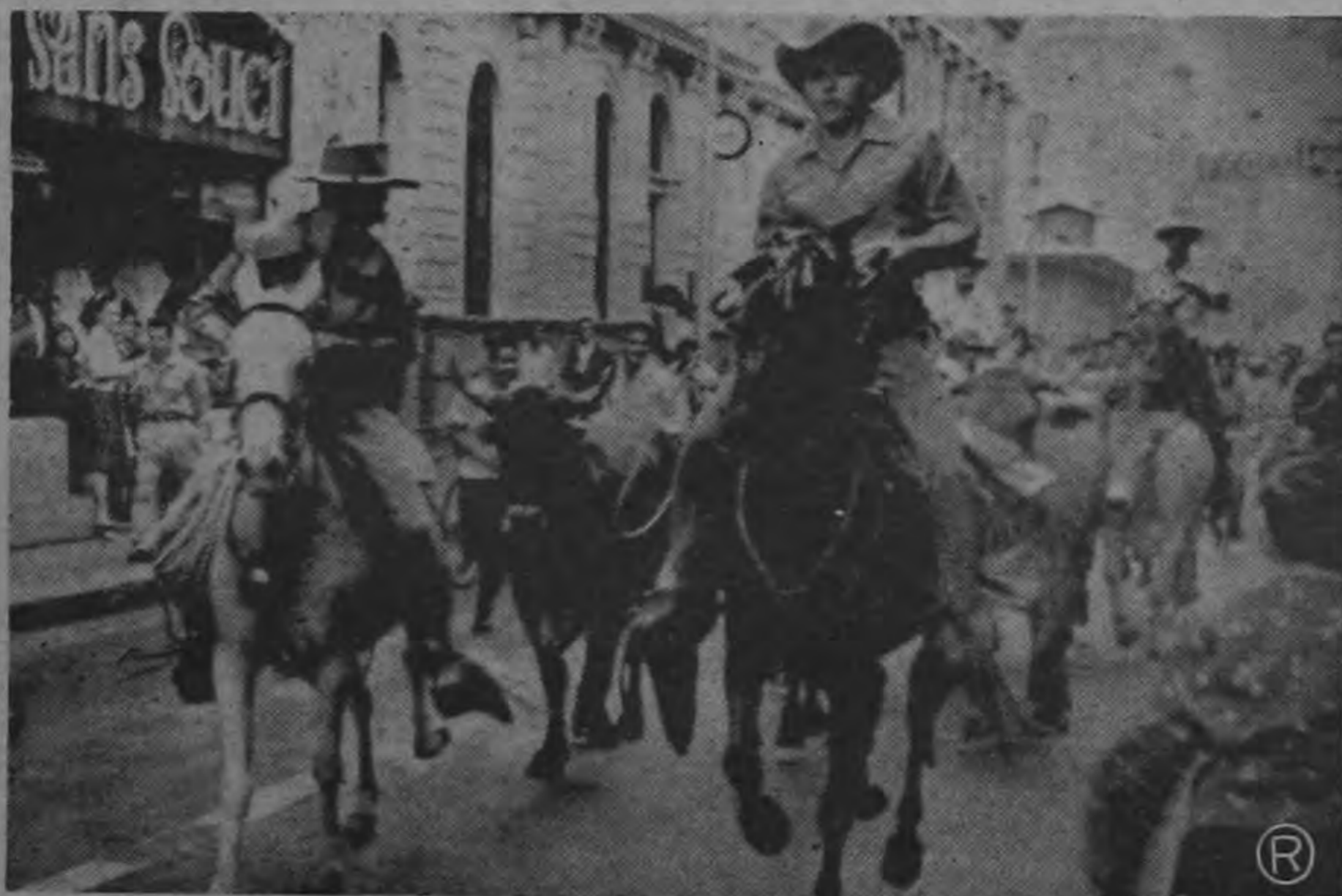
Un aspecto del tradicional "tope" que ayer como todos los años, tuvo verificativo en horas del mediodía. La gráfica de Solano recogió el instante en que un grupo de jinetes desfilaba por la Avenida Central haciendo gala de sus artes y demostrando diferentes pasos que con fruición les sacaban a los jacos para exaltar la calidad de los animales que montaban