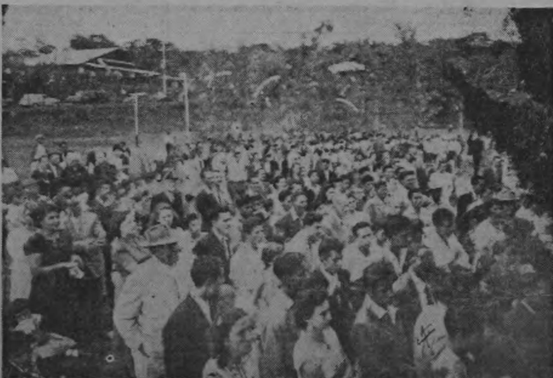
Aspecto parcial de la concurrencia al acto inaugural del Club Campestre Fuerza y Luz, escuchando la palabra del señor Ministro de Trabajo y Previsión Social, Lic. don Otto Fallas M.