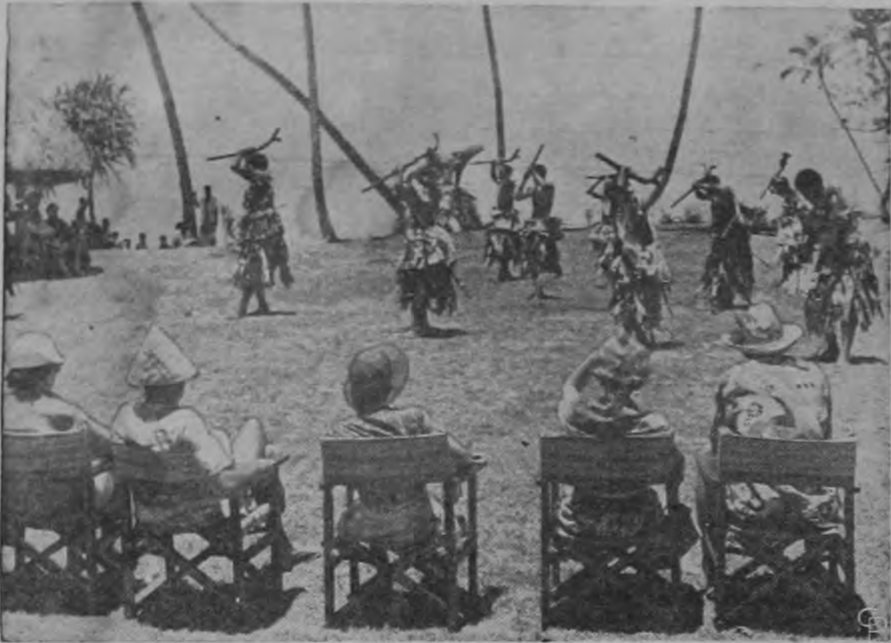
Los nativos de las Fiji escenifican una salvaje danza guerrera canibal... pero nada más como espectáculo para los turistas visitantes.

LA EMPRESA TEATRAL URBINI S. A. desea al Público, un muy FELIZ AÑO NUEVO 1957, y anuncia que ABRIRA LA TEMPORADA, el Martes 19 de Enero, con el más grandioso espectáculo que se haya visto en todos los tiempos: